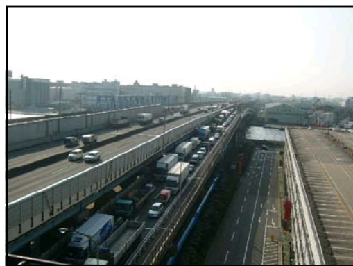
国道357号交通状況 東行き（船橋市内）