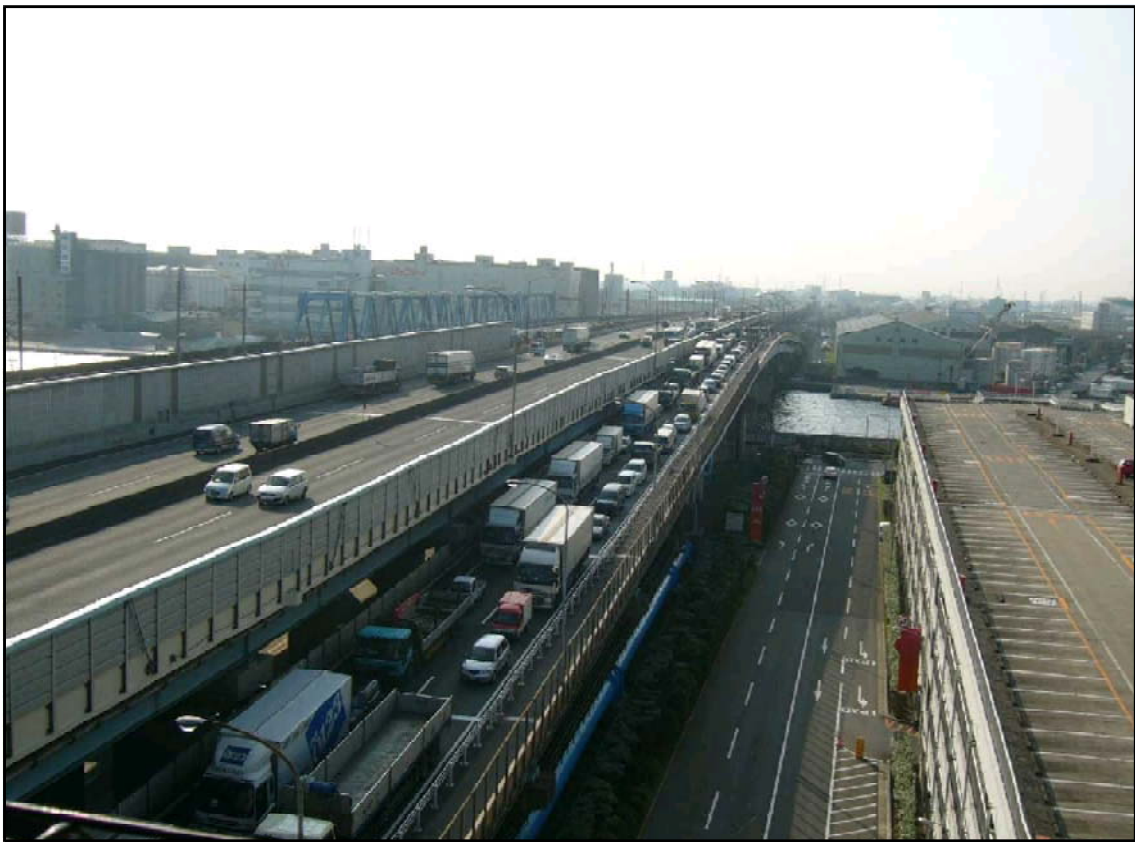
国道357号交通状況 東行き（船橋市内）