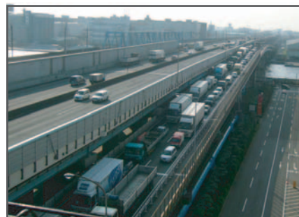
渋滞する国道357号と東関東自動車道（千葉行き・船橋市内）

こうした地域の状況を踏まえ、東関東自動車道の料金を割引くことにより、国道357号を利用する交通の一部を転換させ、交通渋滞緩和・沿道環境改善といった課題解決方法を検証します。