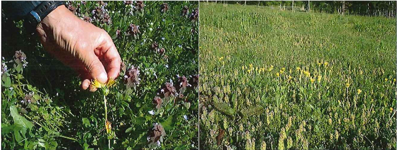
園内に自生する在来種タンポポ

平素より国営アルプスあづみの公園の運営にご理解、ご協力を賜り厚く御礼申し上げます。